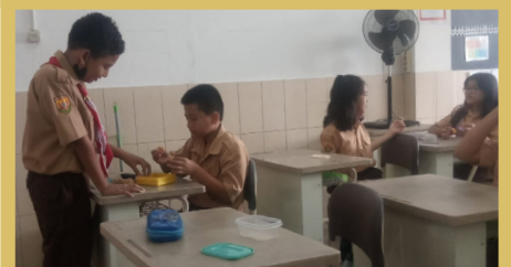
Kelas 5 - Presentasi Kudapan dan Menikmati Bersama