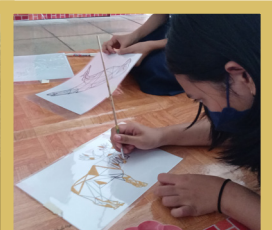
Kelas 7 - Melukis Fauna Geometris